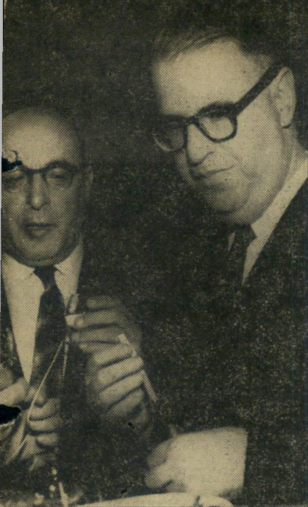
אבן ורפי מי בראש?

נובע גם מעברו כרמטכ"ל, וגם מקירבתו המיוחדת לציבור האקדמאי.