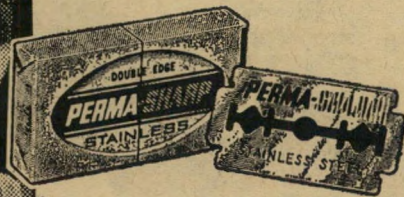
שחם לבינסון אילון