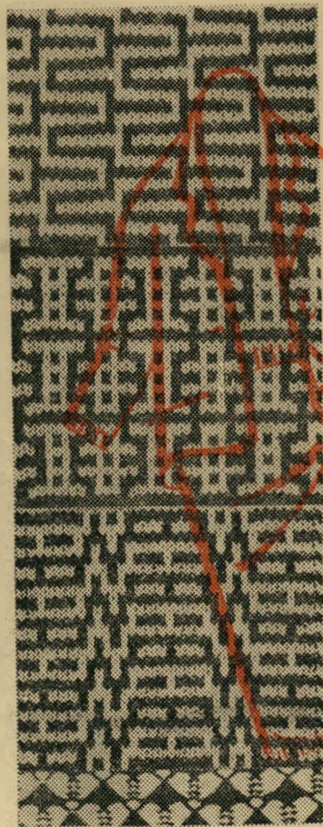
דוגמה ברוחב 8 עיניים