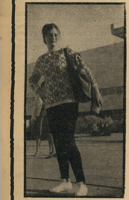
הם המיץ המבוך קש ביותר בקריה. אז מה הפלא שחן באות במכנסיים?