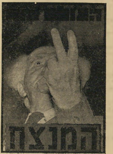
"העולם הזה" 1154

פעם, לאחר הבחירות של 1959, הופיע דויד בן-גוריון על שער העולם הזה (1154) שנשא את הכותרת "המנצח".