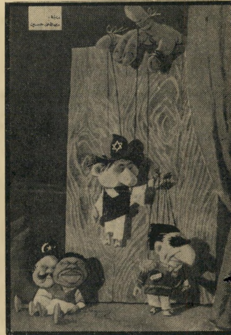
הקאריקטורה של "אחר סאעה" הוא לא שמע את החדשות

מסע זה, לרכוש ידידים ולהשפיע בחברה המדינית, הבשיל פירות מהירים: מוסקבה וקאהיר הסבירו ששוב אינו מתלהבות