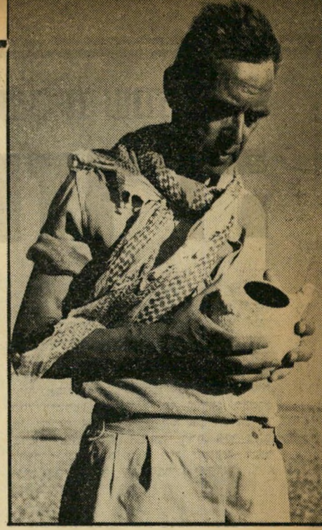
פזזה לצורכי צילום: נלטון גליק בוחן כד חרס קטן שמצא בעת סטייד נגנב באחד מסעות הארכיאולוגיה שלו.

מאמרו של ד"ר אהרוני. אך מאמרו של גליק לא השאיר שום ספק, כי הוא הוא אשר גילה את החורבה וזיהה אותה כי מצודה של מלכי יהודה. היתה זו גם אחת ההודמנויות הנדירות שגליק פירסם תצלום של עצמו ליד אתר.