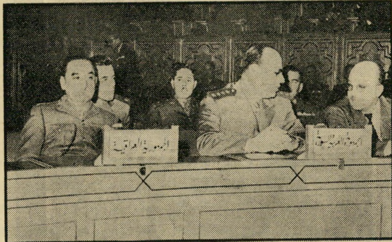
רמטכ"ל עיראק (במרכז) בראש המשלחת העיראקית-סורית "פעילות הבעת הפאשיסטית" —

לחדרו — או! שוקיירי אף ידע לספר כיצד התגלו תוכניותיה של ישראל. זה היה, לדבריו, ב-1950, כאשר ייצג את סוריה באומות המאוחדות. "הצלחתי להשיג חוברת ישראלית סודית, בה הודפסה מפה עם פרטי תוכנית הטיית הירדן. העברתי אותה