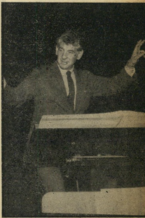
כנ"ר מותר לעסן