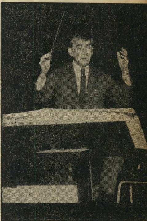
כנ"ר מותר לצחוק