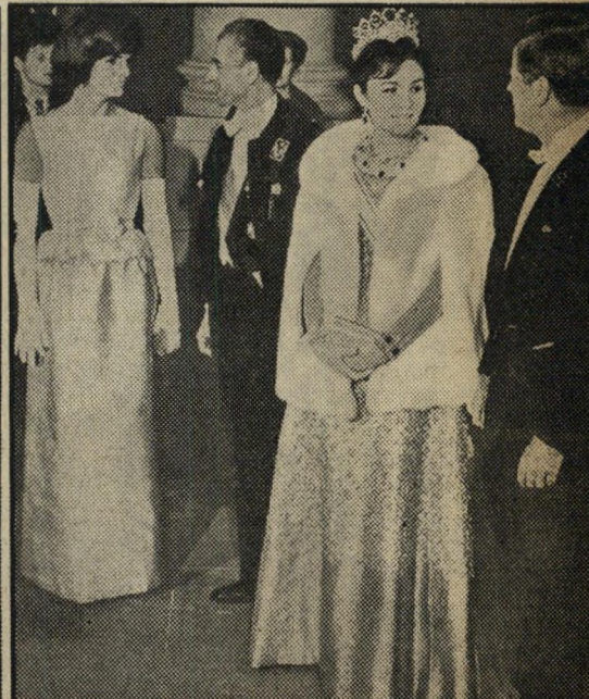
עם קיסר פרס