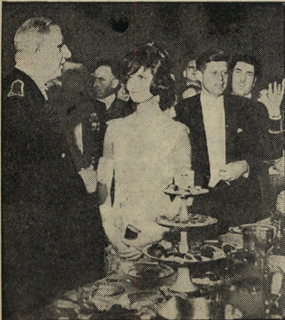
עם נשיא צרפת

מה אומר מושג זה? פירושו: השלום אינו נופל מן השמים, שאין טעם להמתין באופן פאסיבי תוך התכוננות אקטיבית למלחמה.