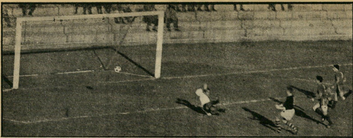
יצחק יוסוקר סופג את השער הבודד לחובת הנבחרת צפוניים בחופשה