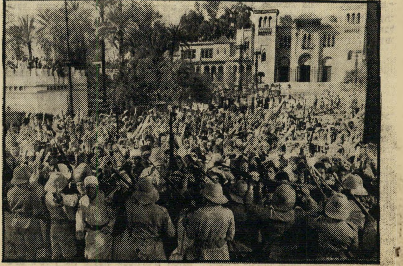
בסרם: הבריטיים מול ההמון הלאומי של העיר דמשק

פשוטו כמשמעו. מטפרי-הלימוד הערביים נתלשו הדפים בהם מוזכר המרד. לפחות מורה ערבי אחד פוטר מפני שהעז, למרות זאת, להזכיר פרשה זו בכיתתו.