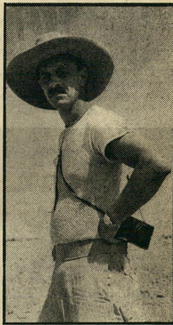
ארכיאולוג ירדן במחנה רומאי

נטישתה כל אמת שהמצב בה אינו מוצא חן בעיניו. להיפך: הוא נרתם למאבק לשינוי המצב במולדתו, בהתאם לרעיונותיו. זוהי תגובתו האינסטינקטיבית של בן האומה העברית החושה. מול נחשול הכפייה הדתית, הממרת את חייו ומדכאה את מצפונו, אין הוא מחליט לברוח, אלא להיאבק. אך לא זאת תגובתו של יהודי דתי. אנשי מאה-שערים הודיעו מומן שהם מבכרים לחיות בירדן, תחת להיות תחת עול הציונים האפיקורסים. ואילו הרב הלבדשטם, אדוננו-מורנו-ירבנו מקלויזנבורג, מעדיף גלות נוחה יותר, באמריקה המשגשגת. למחרת היום הודיע האדמו"ר מקלויזנבורג ששינה את דעתו ונאות בכל זאת להישאר בארץ, אך הדבר אינו משנה במאומה את הלך הרוח המשתקף בהחלטה המקורית.