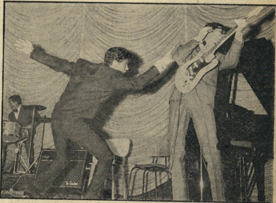
קליף ריצ'רד באחת מתנועות הקצב האופייניות שלו, כשהוא מורה באצבעו על נגן הגיטרה הנק מרוני, איש להקת הצלליות. בתום ההופעה מיהר קליף לרדת מן הבמה, לא הסתכן בהופעות-הדרן.

עלי ללכת ואסור לי לשבת הרבה. פונה אני אליך: עזור לי עזור לי במשהו כדי שאוכל לראות אותו ואת הצליליות. קשה לי ממש לישון בלילה מרוב אכזבה על שאיני יכולה לראות את קליף בהופעתו. ואילו אברהם לינגהרט מחולון ביקש טו"ב מה מסוג אחר: אני סטודנט העומד ל סיים בימים אלה את לימודי באוניברסיטה. בשעות הפנאי אני עוסק בחיבור לחנים ו פיוזמונים, שוכו לשבחים רבים מפי ידידים ומבנינים במוסיקה. זמרת ישראלית ידועה אף הסכימה לשיר את שירי אלא שאני מחפש הזדמנות גדולה יותר לפירסום פיוזמוני. הזדמנות זו מתגלמת בקליף ריצ'רד. כל מה שאני מבקש הוא ראיין בן 5 עד 10 דקות כדי שאוכל למסור לו את פיוזמוני. אני בטוח כי הוא יבלם ואף ירצה כי אמסור לו פיוזמונים נוספים. הפיוזמונים שלי הם שלאגריים!