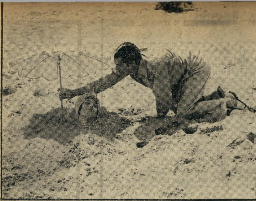
4. גירושין נוסח איטליה (איטליה)