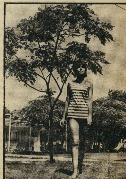
היא תשוקת צ'ירה בת שמור עממית מבהינה כלכלית, מחשבתית ורגשית.

ברמת-אביב נדלק שוב האור האדום. גיזל והחזרה אקספרס הביתה, אל ספסל הלימו