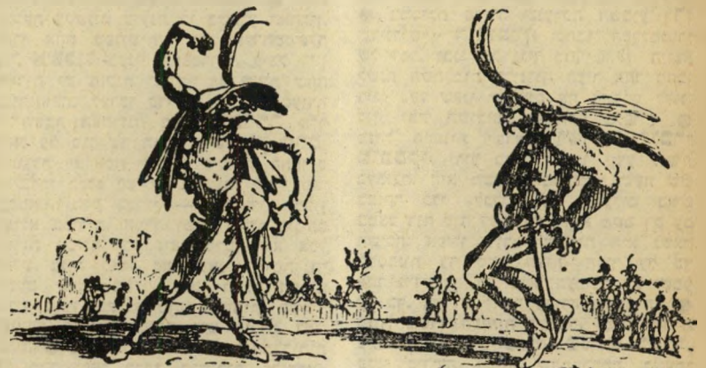
ציור מהמאה ה-17 מתאר שני שחקנים של להקה נודדת, המציגים בכיכר השוק קומדיה דל-ארטה, כשהם לבושים ב' תלבושות ובאביזרים אופייניים, בהם הופיעו שחקני הקומדיה דל-ארטה בכל מחזותיהם.

ל א הלו להם כל מחזות קבועים. היה להם רק סיפור-עלילה בקחים כלליים, בו