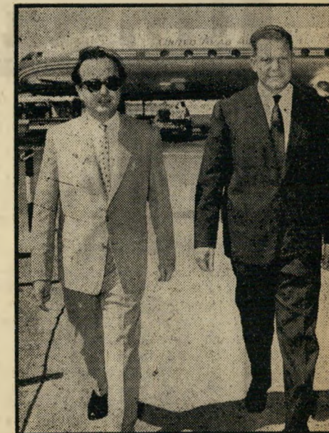
אליסאריס וליסאריס בניקוסיה אלה שחשפו את איימן...

אולם הישג העיקרי היה אחר: פעולת המשלחת מנעה כי שוב יתקבל אוטימאסית החלטות אוטיש-ישראליות. אילו לחצו המיצ-רים על הוועידה לקבל החלטות כאלה, היה הדבר גורם לחיכוך כללי על נושא זה. הם ויתרו על נושא זה, בידעם כי הוועידה טורדה בסכסוכים על הסכם מוסקבה. תחת זאת הסתפק המזכיר המצרי בהפצת התחל-טות האנטי-ישראליות שנתקבלו בתורש פברואר בהעידת מושי, בסנגניקה.