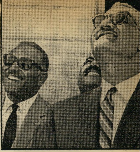
נשיא מצרים חחה בשיגור טיל