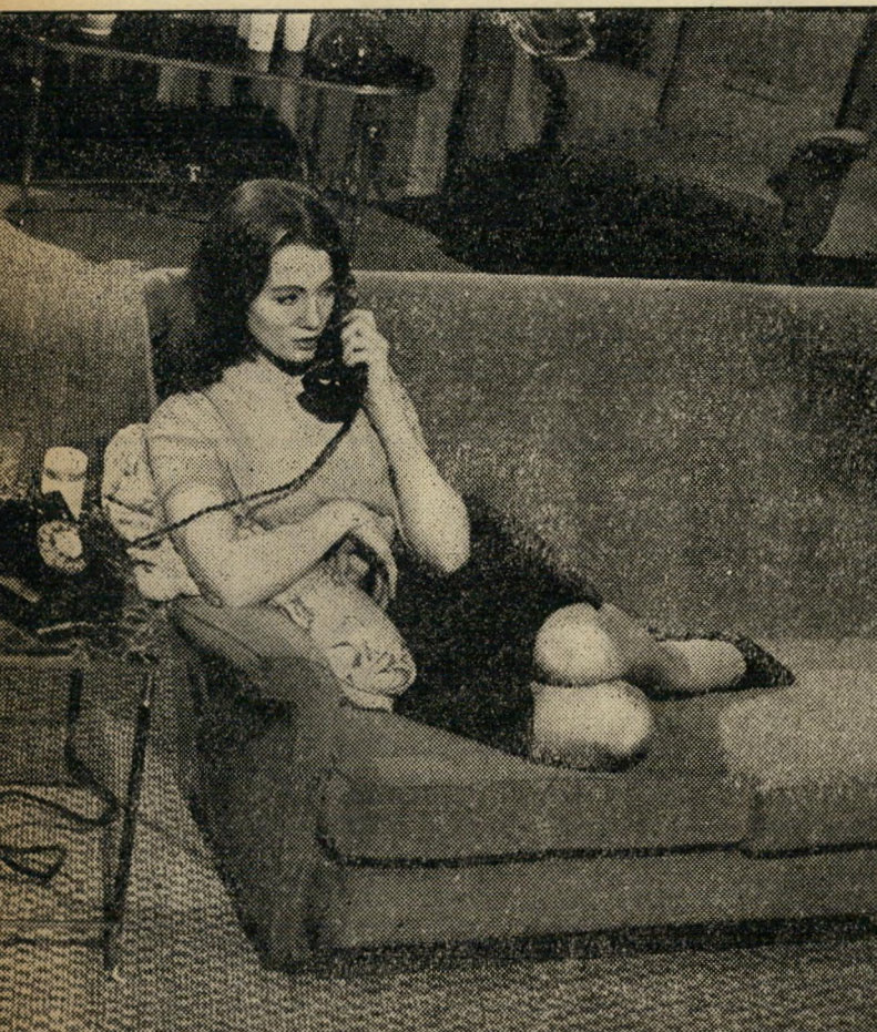
טלפונאית כריסטין קילר משזקת את עצמה במיבזון-בד

תוך שבועות מעטים הפכה כריסטין לאגדה חיה, בצד אגדות היסטוריות כמו מאדאם פומפדור, לידי האמילטון ודוירה. היא גרמה למותו של איש, דוקטור חרדי, להרס של איש אחר, פרופיטור, ולזעזוע ממשלתי שאין לו תקדימים רבים בהיסטוריה הבריטית החדשה. חברות-הסרטים התחרו על הזכות להסריט את חייה, עתונים שילמו הון-תועפות כדי לפרסם כמה מילים מפיה. הזונה חסרת-הבושה הפכה, כמעט, מוסד לאומי. בישראל נפל שר-הבטחון בשל מרידה מפלגתית. בגרמניה נפל שר-הבטחון בשל התנכלות לשבועון. רק בבריטניה נפל שר-הבטחון בשל יחסיו עם אשה — וכריסטין קילר, סמל הכוח הנשי הניצחי, עלתה לגדולה על גופו.