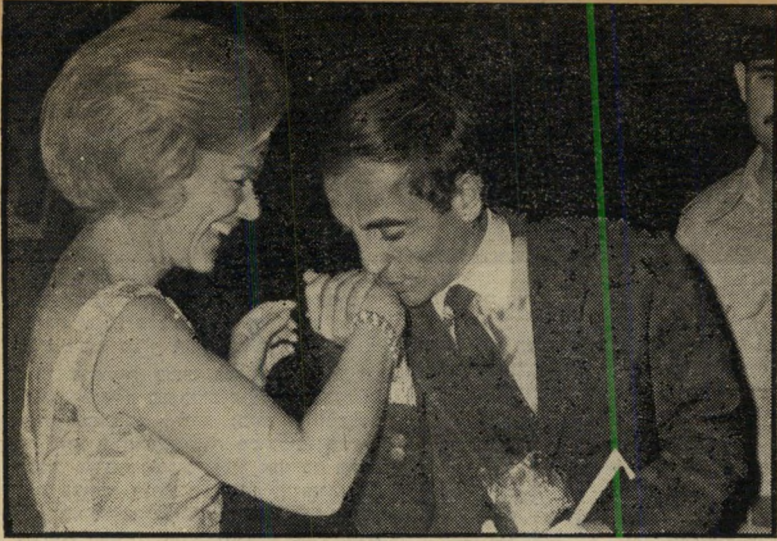
שארל אונאבור מנשק יד מעריצה בלוד נשים בלונדית וחולצות ורודות

המתינה לו שם אותה פאריסאית, שהביאה עמה לכבוד המאורע אף ידידה נוספת מספא ריס. שארל הקטן נישק באדיבות את ידה (ראה תמונה) והשתיים הפכו מזדנבות קבוי עות שלו. בהופעת הבכורה של אונאבור בתל-אביב הסתער עליו הקהל ועמד לשאתו על כפיים. שוטרים מילטו אותו מידי המון מעריצים שציפה לו בחוף.