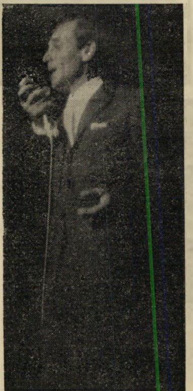
זמר אונאבור לאשה המגעילה ולבעל המזויח

האמרגן שכח את הבטחתו. אולם כשי הגיע אונאבור לנמל התעופה בלוד, כבר