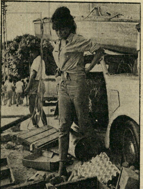
מוכנת יודר-אביב מבדי-הגפן

גיסתו של פוציץ. "אולי אנחנו אידיאליסטים", אומר פוציץ, "זה יכול להיות. אנחנו מתביישים בכך ו לא מודים. פעם הלכנו להיות חקלאים מפני שלימדו אותנו שלהיות איכרים זה צו ה שעה. מאז גדלנו קצת וראינו שיש עוד דב רים חשובים בארץ — סרטים למשל, מיצר תעשייתי העשוי מרות."