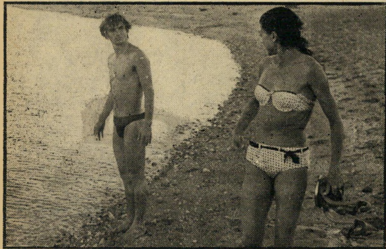
אומר נורייב לפונטיין, כשרגליו בתוך המים. שני רקדני הבלט ממעטים לצאת יחד. רק נרדמה על כתפו של רודולף (למטה מימין).