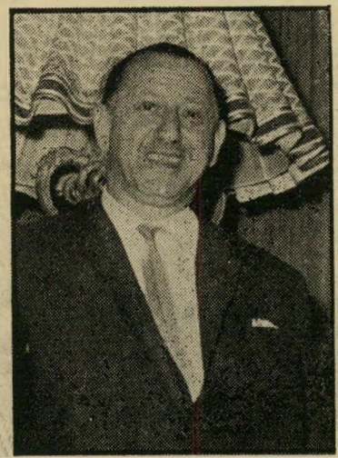
CHEZ NOUS מישל, בעל המועדון נו מופיעות הנבריים הנשים, הגיע ארצה על סיפון אנית אלסלינה.

דונו, נושאות אליו חצי-תריסר נערות גר-מניות עיניים שופעות-ערגה. שמעון עצמו אינו מבזבז עליהן אף מבט אחד. הוילול הגמור הוא השיטה הטובה ביותר. המועדון הישן של שמעון נועד עתה לבני הטפשי-עשרה. זהו מבוכ של חדרים חשוכים או מוארים-למחצה, המצוייד בכמה בארים, כמה רצפות-ריקודים, פינות מוצנעות לור-גות, מקום מורם לאנשים מפורסמים. בפינה אחת מוקרנים סרטים ישנים של צ'פלין, בי-פינה אחרת משליך פנס-קסם תמונות של חתיכות ערומות על הקיר, בפינה שלישית יכול אדם לבדוק במכונה מיוחדת את מדת שיכרותו (על פי מהירות תגובותיו). האוטו-מאטים נותנים לקהל את הכל — קפה (שלושה סוגים), סיגריות, קקאו, קוקה-קולה, אמצעי-מניעה (בבית-השימוש של הנברים) וגרביים (בבית-השימוש של הנשים, לאותן שגריביון נקרעים בעת הריקוד).