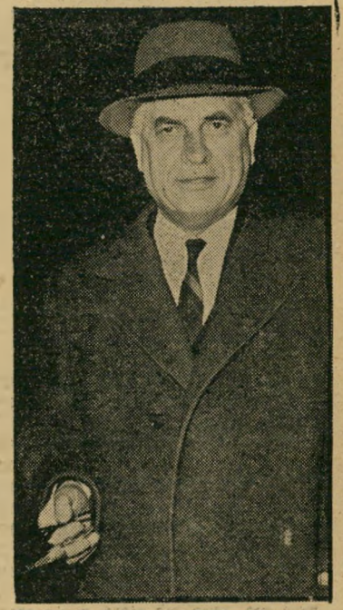
שריהמנים שפירא מחירו של הנצח

הגבר הגבוה, בריאהגוף, מחה את הויצה מעל פניו העגולות. מעולם לא נמצא אב