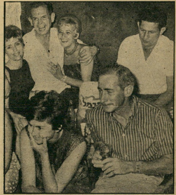
בני מהפילהרמונית (ימין למטה) לפני — ואחרי התאונה, בחברת איזי (במשקפיי-שמש) *

ערב כמעט: לידיה הלבוראנטית, אילנה הי"שוטרת בדימוס, ציפי, ושני תיירים צרפתיים צעירים. המסע אל תוך הלילה היה הפעם קצר ביותר. הוא הסתיים במרחק 500 מטר מן המועדון, על עמוד החשמל של סימטה יפן-אית צרה, בין ערמות אבטיחים. קבוצה שניה של חוגגים, שהגיעה כעבור כמה שניות רכובה על גבי סוסיתה, מצאה את השברולט הפוך על צידו, כשנוסעיו אינם יכולים להתחלק. פעולות ההצלה החלו מיד. נסיון לנפץ את חלון הדלת בעזיטה עלה בתוהו. מי שהו ניסה לנפצו באגרוף, הצליח, אך חתך את ידו ויצא מכלל שימוש. הציל את ה"מצב בחוש התמצאותו המהיר אביה הי"שמוע אל תוך הלילה לשמוע את התזמורת הפילהרמונית הישראלית מנגנת את הקונצ'רטו של לילה. לקומץ קטן של תושבים, דיירי שכונת מנשייה, הזדמן ביום חמישי האחרון לשמוע את שירת התקווה בפעם נוספת: הפעם, בשעה שלוש לפנות בוקר, בקע ההימנון מתוך מכונית התזמורת הפילהרמונית, ששכבה הפוכה על צידה, אחרי שניסתה לטפס על עמוד-חשמל. דקות מעטות לפני-כן, התנהלה מכונית השברולט השחורה בגילגול עליון מכוון מועדון הלילה היפווי עומר כייאס, שם