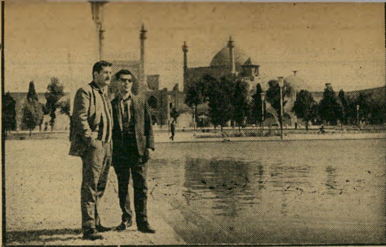
איספהאן — עיר המיסגדים והליבלוך* *מה זה כאן חיי אדם?

אך חושבי איספהאן אינם כועסים על העיר הישראלית. להיפך. הם מברכים אותם ומחייבים לעברם כאשר הם נפגשים בהם. כי החפירות והרעש נעשים למטרה אחת: להתקין באיספהאן את רשת הביוב הראשונה שלה. כאשר תושלם העבודה בימים ה-