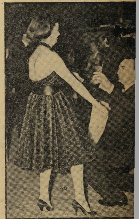
על הבורניים רוקד שר'ה מלחמה לשע'ר, בר, פרופיומו, בחברת אשתו השחקנית.

שמועה על מותו של ד"ר וורד השמה את העולם כולו, גרמה להלם, לזעזוע, לטעקה גדולה על מצפון האמה הבריטית, שיום קודם צתה בו עדיין ב"סקרנות משועשעת". הגירסה הרשמית היתה: ד"ר וורד איבד את עצמו לדעת. הוצגו המכתבים שהשאיר אחריו, וסופר על ראיון עם כתב הדיילי אקספרס. ערב מותו, בו סיפר בהתרגשות כיצד מתנכלים לו. אך עם חלוף ההדהמה הראשונה - החלו להתעורר ספקות. תחילה בצורת רמזים, ש"הפכו לבסוף לתמיהה מגובשת: האם באמת התאבד ד"ר וורד?