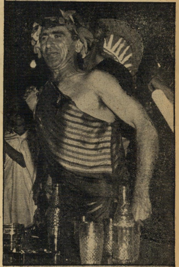
המדך ממבוש הראשון

בזאת הנני מכריז על ברית אחיות עם נסיכות תל-אביב. מהיום והלאה רשאים תושבי תל-אביב להיכנס לגבולות הממלכה באופן חופשי, אולם זאת בתנאי שתושבי ממלכת ממבוש יוכלו לבקר באופן חופשי בנסיכות הנ"ל.