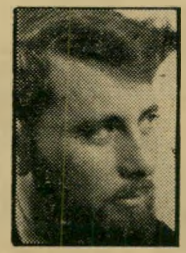
מאת אורי אבנרי

חבר הכנסת בגין הטיח כלפי האשמות חמורות, אשר ככל שהן חמורות, כך הן בלתי מדיניותיות. אין לי חופשי דיבור כמוהו, אך על שתיים מטענותיו לפחות אענה מיד: על פיתוח טילים במזרעים — כולל טילי קרקע-קרקע — מסרתי לנועדה התוקף והבטחון 26 לינואר 1962. מר בגין הטעה את הכנסת, באומרו שהנועדה לא ידעה על כך לפני הפירסום בגירוסלם פוסט.