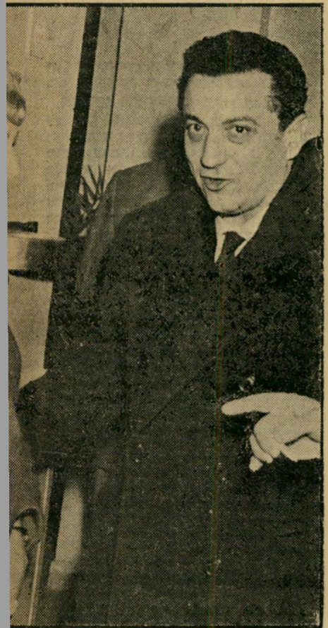
הזמר האיטלקי מרניו מריני, מציג בהופעותיו, חזר אולם לא תירגם את הערצתו לשפת מעשים — וד

בעלת-שם בעולם-הבידור כאדי קאלברט, תשים עינה בזמרת צעירה ובלתי ידועה, ואחרי שישמע את קולה פעם אחת בלבד, יציע לה הצעות, שכל זמרת מנוסה היתה תוספת בשתי ידיה. אולם אלים לא הניחה להזדמנות להישמש