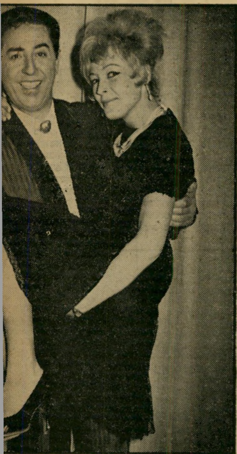
הזמר השווייצרי וימו סוריאני, נזר שישישה מנחה ו תמד את קירבתם של אמני בידור בתקוה שיבוא יו