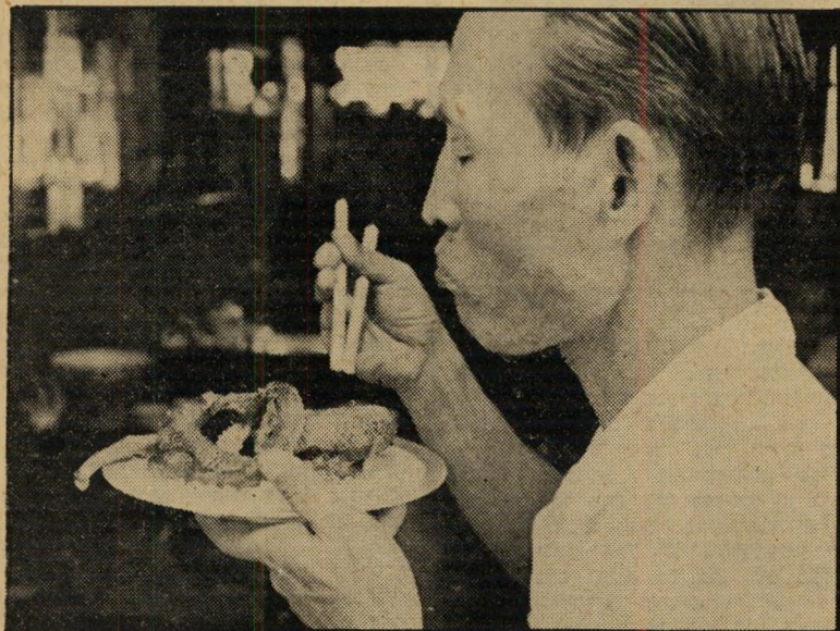
ארוחת נחשים במונרו קאנה

מבחינת העיתוי איחר הסרט את רכבת- המשאב שלו בכמה שנים. הוא נועד ללחום בחוק שראה בהומוסקסואלים פושעי-מין,