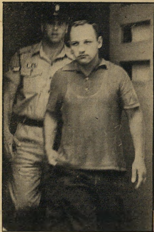
השוד שמואל קרן כמעצר קרניים לקרן

יורם אף לא הספיק להסתובב. קליע אקדח מסוג ויבלי, חדר באותו רגע לגבו, חלף דרך חוט השרדה. הוא צנח, שותת-דם, בחדר המדרגות האפל. „אוהה, אמא“, שמעה אימו את גניחתו, מהקומה השלישית, ירדה לקראתו, ואיבדה את