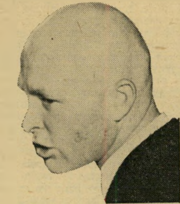
מאת אורי לוי

המשחק האינדבידואליסטי המופרז שלהם, אשר גרם להשיית ההתקפה, איפשר תמיד