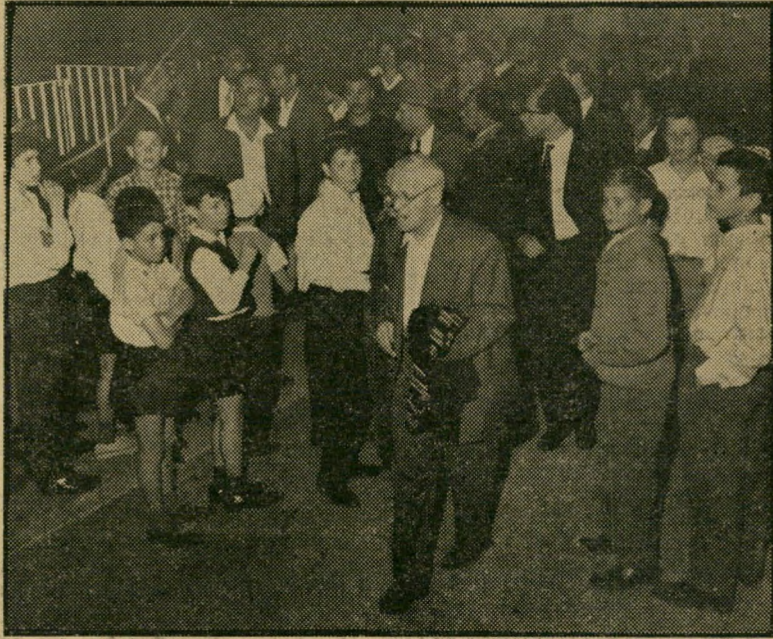
מצטופף קהל רב של אזרחים, אשר שמעו על למצבו החמור של הנשיא. על פני כולם ניכרת הדריכות המתוחה, שעה מאבקו האחרון של נשיאם, הנאבק במחלתו.

"סימן לאבל!" פסק מישהו, ומיד לאחר מכן פשטה השמועה: "הנשיא מת." שמועה שהתחזקה, כאשר יצאו מיד לאחר מכן המבקרים החשובים שבאו לבית הנשיא. הם יצאו בזה אחר זה, עזיבים ונוכחים. היתה זו טעות. ההגל הורד לחציה-התורן כדי לציין את התחלת יום הזכרון לשואה. כעבור יומיים, שוב פשטה שמועה. הפעם גם לה קולי-ישראל. כמה דקות לפני סיום שידורי הגל הקל של בוקר יום ב', הושמעה נגינת המנון הלאומי. היה זה ביצוע קונצרטי חגיגי מאד של התיקווה, וכל מאזין חש ששידור מגינה זו, בשעה זו ובמקום המוסיקה הקלילה של הגל הקל, פירושה רק אחד — הקדמה להודעה על פטירת הנשיא. ואומנם, בדיוק לכך נועד תקליט זה.