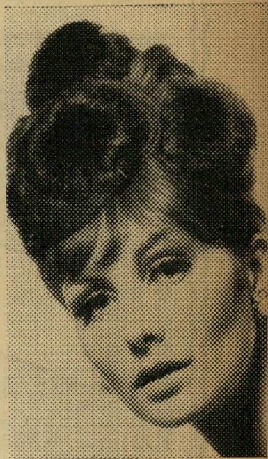
מושג עליזי איפור ב"Coverfluid בגוף החדש, "Sand Pearl". עצמות הלחיים מודגשות ב"תערובת של Silk Tone Liquid Rouge. "Coral Tone" יחד עם "Eye Shadow 'Pearl". לבסוף יאובקו הפנים קלות בפודרה זוהרת בגוף "Opaline".

כוכב בעין. הקווים מעוגלים, ולפנים הזוהר הפנימי העמום של פנינה. דבר זה