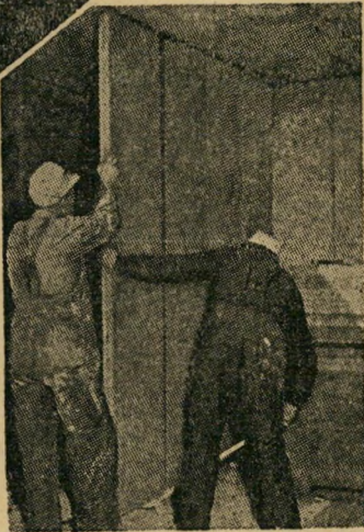
בטרום משורין למחיצות