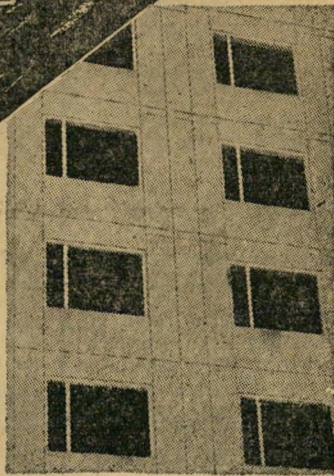
בטרום משורין לתקרות חוץ

ביח"ר: פרדס-חנה, טל. 2838, חדרה משרדים לקבלת הזמנות: תל-אביב, שד' רוטשילד 73, טל. 61379 חיפה, רחוב הרצל 1, טל. 69251 ירושלים, רחוב שלומציון המלכה 2, טלפון 27419