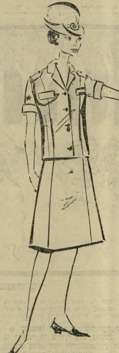
המדים החדשים של השוטרות ליידי ברחוב