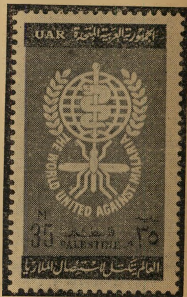
הבול הפלסטיני מדינה אין, בול יש

הכותרת בחנותי הבולים בהאמבורג ציינה: "פלסטינה". כותרות דומות פיארו אותה. סידרת הבולים בערים רבות אחרות בעולם. הבולאים ולקוחותיהם לא העלו על דעתם כי כרגע אין כלל בעולם מדינה ריבונית הנושאת שם זה. היא נעלמה ב-1948, כאשר בולי המנדט הבריטי יצאו מן המחזור, במקורם באו בולי ישראל ובולי מדינות ערב. כיצד, אם כן, נולדה פלסטינה מחוש? על ידי טכסיס פשוט של קאהיר. ממשלת מצרים