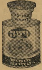
גביע צמוד לקופסה