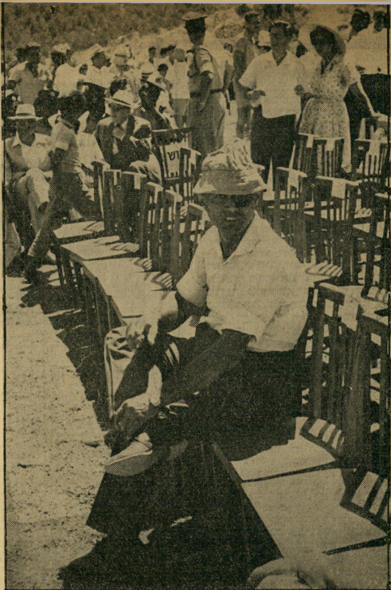
משה דיין בטקס נטיעת יער הופואה-בואני טוב טמבל סמבל

בהזמנות נא לפנות לכל סוכני תריז - תעשיית תריסי אסבסט בע"מ. המשרד הראשי: רח' פרופ' שור 7, טל. 42193 ת"א.