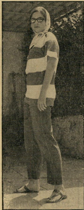
ברחוב תחנה להרפתקה