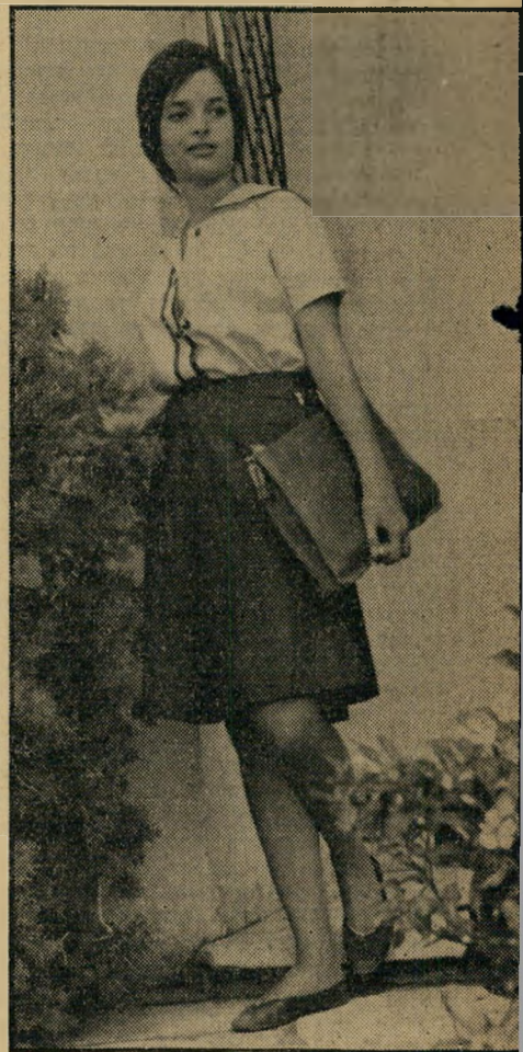
בדרך לגימנסיה אימת המורים

אולי מפני שההררכה נתנה לי שליטה בבני אדם. אבל לא השתלכתי בחברה. זאת לא הפעם הראשונה. גם בבית-הספר העממי הייתי מאוד לא אהודה. ישבתי בצד, לא הופעתי לפגישות כתה, בחלקו מפני שזה לא התאפשר לי מבחינת הבית. הייתי נתונה למצבי רוח. לא היו לי חברות בבית-הספר. באופן יוצא מן הכלל היתה חברה אחת. היא היתה עילוי. אחרי זמן קצר הסתכסכנו על הרקע מי יגיד ומי יקבע.