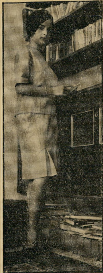
בחברה ליטוש סופי

«הקפיטנים האמיצים היה הסרט הראשון שראיתי. בגיל שמונה. היה הסרט הראשון