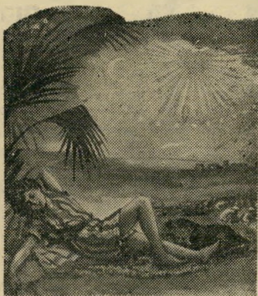
"ויהלום יוסף הלום"

לאחר ההצלחה בארה"ב ובארץ וברשות ההוצאה "סאן", ניו-יורק "ספורי התנד" בחמונות"