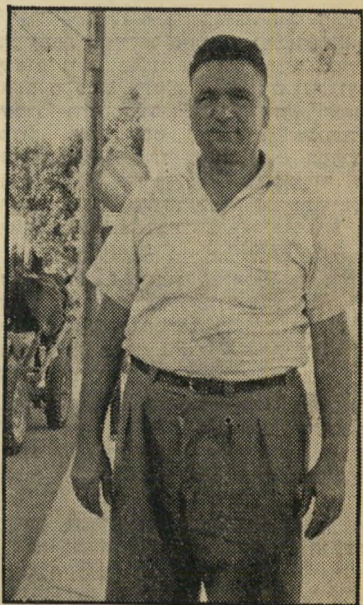
מנהל צרכניה חכמון

מוכיר ועד העובדים לא ידע על הפיטורין, הסביר לתמרה שאינם חוקיים ושעליה