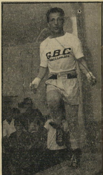
— קופץ עד הבז — לא להתיד...