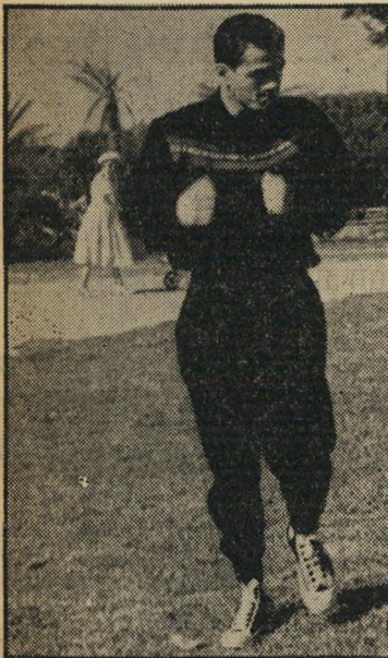
— רץ בגן העצמאות — לא לדבר...

וכדי להתמודד פעם נוספת על תואר אלוף אירופה יהיה עליו לנצח קודם כעשרים מתאגרפים אחרים הטוענים לכתר. נוסף ל- כך לא יוכל עוד לדרוש את השכר שהוא מקבל עבור קרב איגרוף אחד שלו — כ- עשרת אלפים דולר.