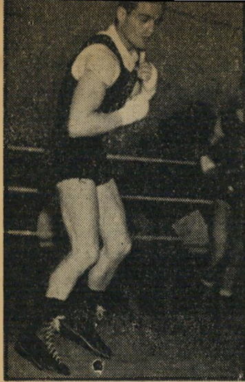
— האלימי חובט באוויר — לא לשמוע טובות...