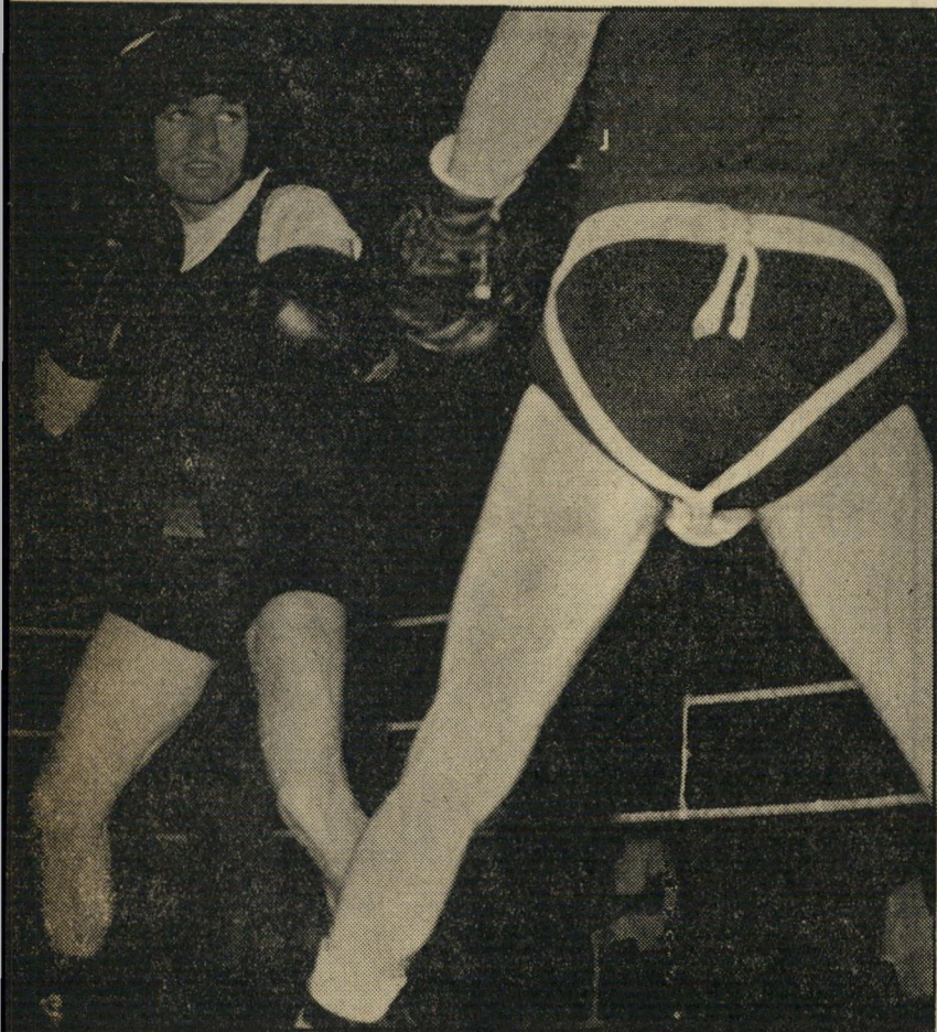
— ומתאמן בזירה — כדי לנצח