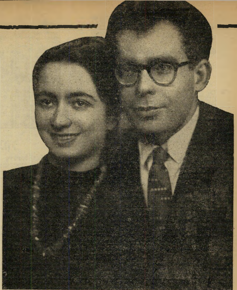
(המשך מעמוד 15)

כתב הוא על נושא זה, באחד ממכתביו האחרונים, לפני כשלושה חודשים: "בזמנו כתבתי על נסיוני בהפרדת אבקת יהלומים. ובכך, סוף-סוף הצלחתי במשימה זו ואף הגעתי לתוצאות די מפתיעות ביחס לתוצאות שמקבלים שאר האנשים העוסקים בכך. מכיוון שהפרינציפ היה ביד, הקמנו מעבדה קטנה בבית ואף החלנו מעט בעבודה.