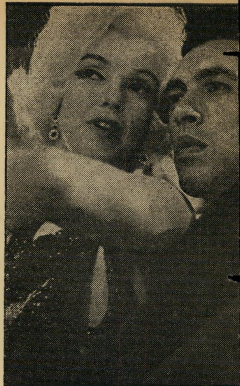
מאריקין ובלאנו תחזית לחווה

אמריקה. אני אורו את חפצי ובא ארצה. הכינו לי באנקט ראוי לפרסקיו" . . . מלאי רוגז ותמיהה על הרבנות הראשית היו יורשי הרב אייזיק הלוי הרצוג, על שלא טרחה לקבל את רשותם להדפסת מאמריו בשאלת ענת בני-ישראל. היורשים, המתכננים להוציא בעצמם את כתבי הרב, רצו לתבוע את הרבנות לדין, שלחו לה הודעה על כך, לא זכו למענה. השבוע התבררה להם הסיבה: מאתר שהבחירות לרבנות עדיין לא התקיימו, טוענים יועצי המוסד שאין שום גוף שאפשר לתבוע לדין.