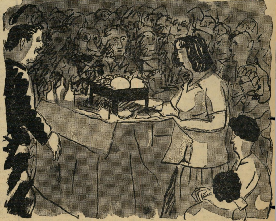
הזוקוקין דינור שהגיעו לכבר הפור (כבר מלכי ישראל לשעבר) מצרפ. במסגרת העזרה הטכנית לארצות נחשלות - זכו למחאות כפיני