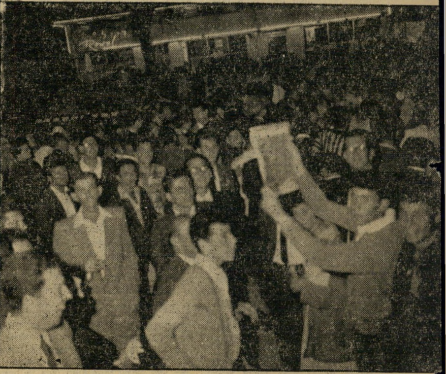
רחוב דיזנגוף חסום: תמונה זו צולמה בשעה שתיים בלילה, מראה את הקהל שפרץ לכביש. מלפנים מראה צעיר גליון שרכש בקושי, מאחוריו מצוטטף קהל סביב מוכר שכמעט נחנק בהסתערות עליו.

איך ידעו על הופעת הגליון? לא פורסמה שום מודעה בשום עתון אחר. קול ישראל אף סירב לפרסם את ההודעה המוקדמת שנמסרה לו לשדור בתשלום. ההודעה היחידה הודפסה במודעה קטנה, ב גליון הקודם של העולם הזה, בה נאמר כי הגליון הבא יוקדם, וכי קוראים תל אביביים יוכלו להשיגו במוצאי-שבת. לא צוינה שעה.