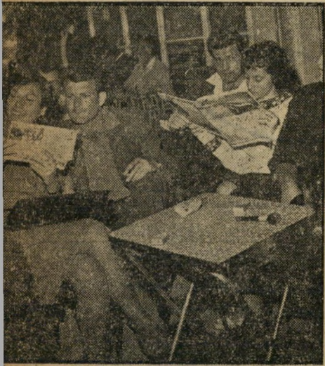
מתיחות וחיוך: זוגות אלה עדיין לא תפסו את חומרת היריעה.