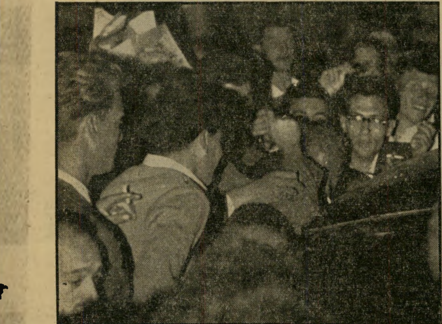
באגריכים ובמרפקים מכתער הקהל על המכונות בה נמצאות חבילות העיתונים, נוזל קפה, "כפית", גורם למחומה ולהתערבותו של שומר.