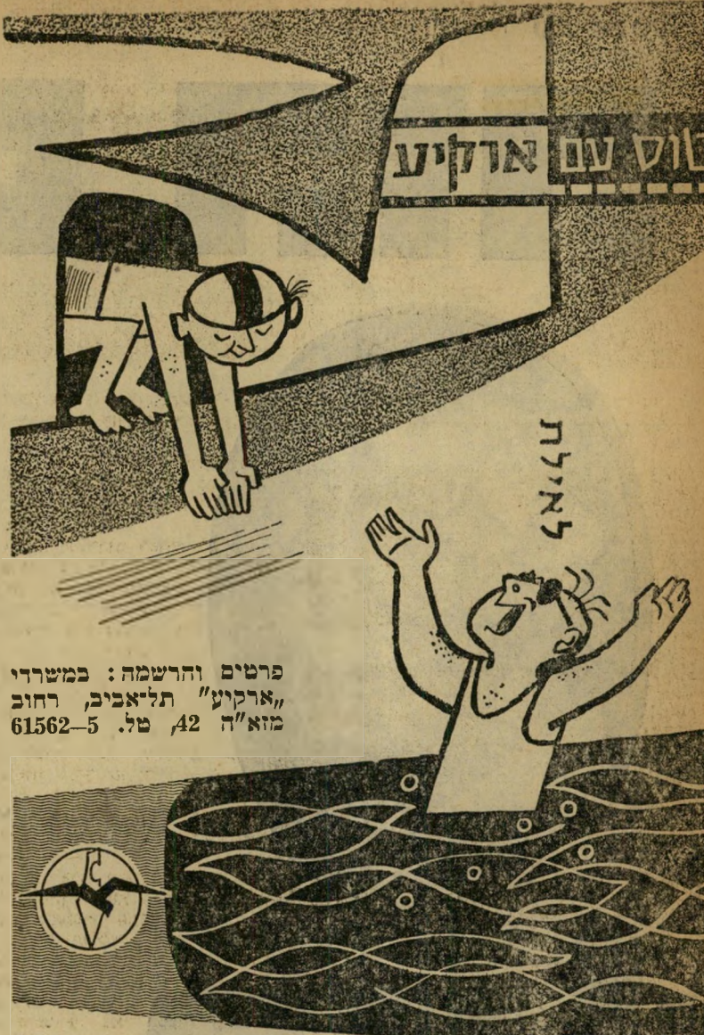
פרטים והרשמה: במשרדו "ארקייע" תל-אביב, רחוב מוא"ה 42, טל. 5-61562