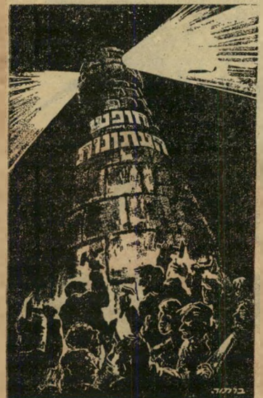
"מגדלור בחופי הכרך"